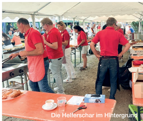
Die Helferschar im Hintergrund