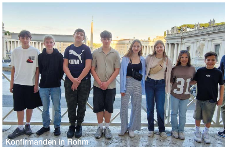
Konfirmanden in Rom