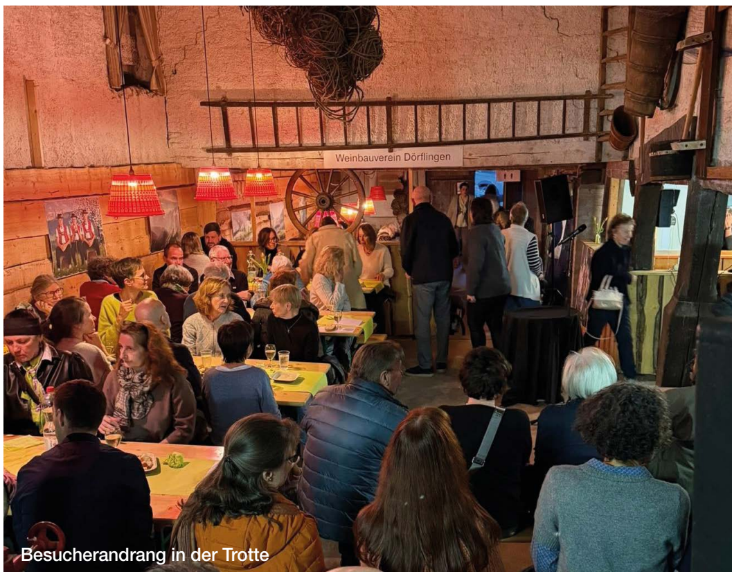
Besucherandrang in der Trotte

Mit der Lesung stellt er seinen neusten Roman «Lovely Rita» vor. Darin übernimmt die Hauptperson die Kneipe «Haus Himmelreich» von ihrem