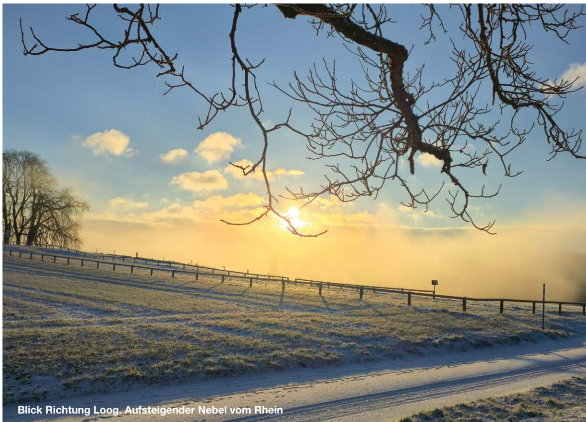
Blick Richtung Loog. Aufsteigender Nebel vom Rhein