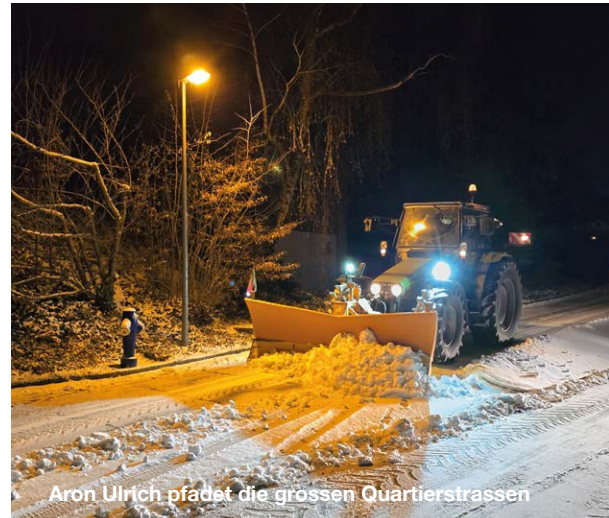
Aron Ulrich pädet die grossen Quartierstrassen