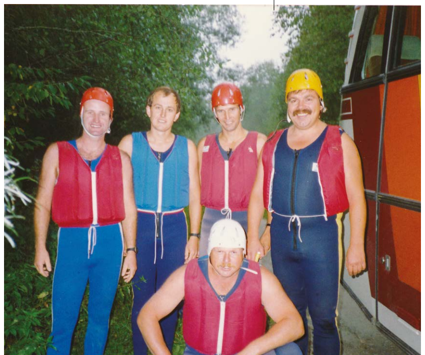
TEXT: PENTTI AELLIG BILDER: ZVG