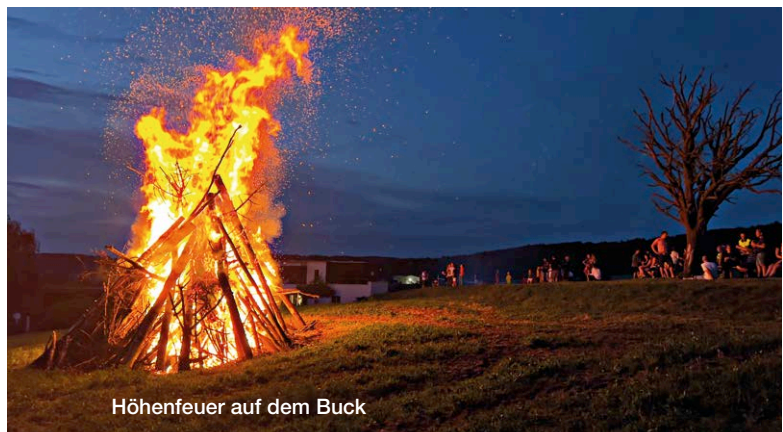
Höhenfeuer auf dem Buck