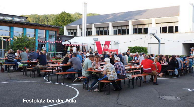
Festplatz bei der Adla