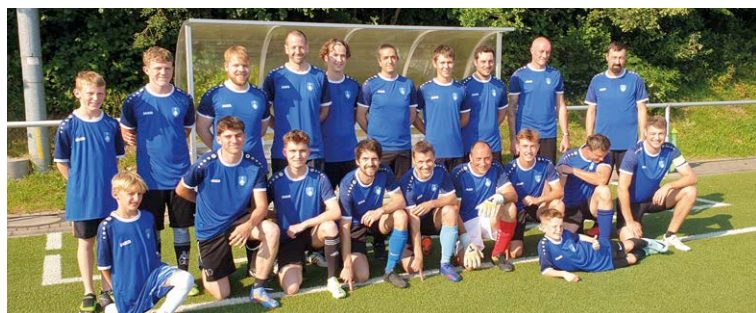
Die Dörflinger vor dem Spiel

Nun wünschen wir dem FCB für die Zukunft weiterhin viel sportlichen Erfolg.