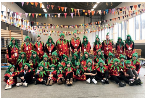
Alle Helfer zu einem Schlussbild vereint