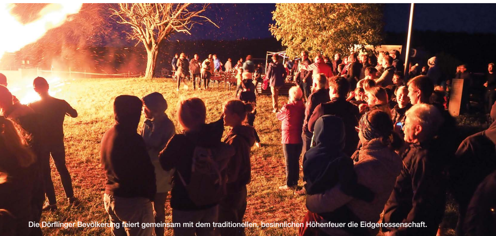
Die Dörflinger Bevölkerung feiert gemeinsam mit dem traditionellen, besinnlichen Höhenfeuer die Eidgenossenschaft.