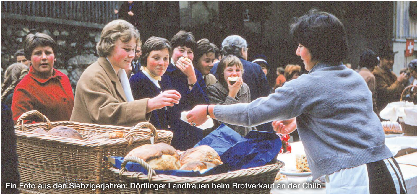
Ein Foto aus den Siebzigerjahren: Dörfli Landfrauen beim Brotverkauf an der Chilbi

Die Dörfli Chilbi war früher eine Angelegenheit, die sich in den Dorfwirtschaften abgespielt hat, wobei im «Gemeindehaus» und früher im Saal der «Morgensonne» (in Neudörfli) Tanz angesagt war. Auch aus der deutschen Nachbarschaft, aus Randegg, Gailingen und Büsingen, war jeweils ein reger Besuch zu verzeichnen.