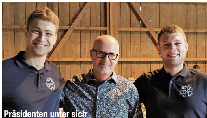
Präsidenten unter sich